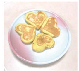
美味しくできました