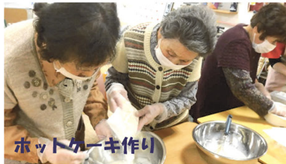
ホットケーキ作り